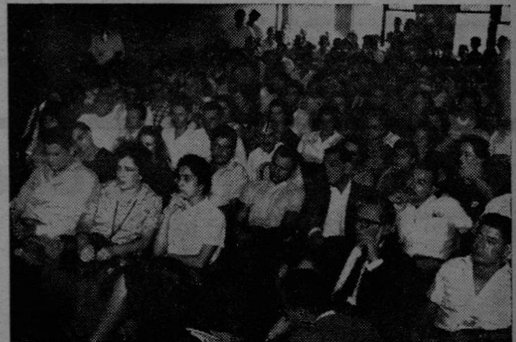
Una parte de los costarricenses de todas las tendencias políticas y todos los sectores sociales reunidos para apoyar el desarme general y la paz mundial el domingo 24 en San José.