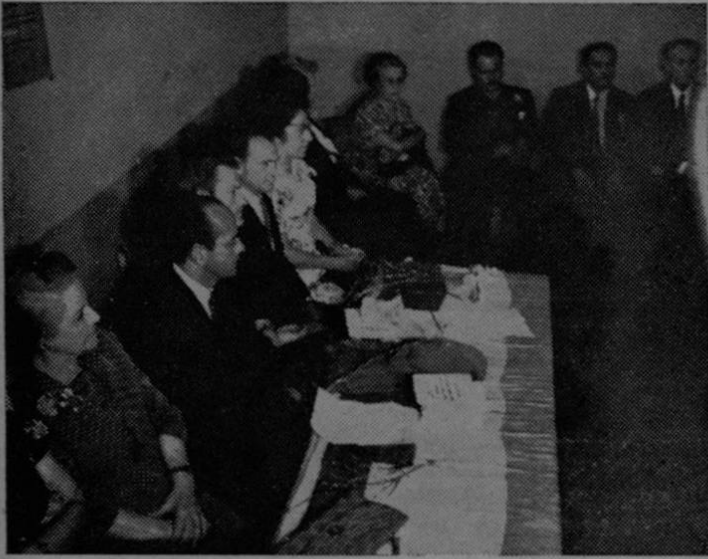
Presidencia de la Asamblea del domingo 24.

La Asamblea Nacional por el Desarme y la Paz, a pesar de todos los obstáculos que las fuerzas reaccionarias quisieron poner a su paso, y a pesar de que la zona donde se realizó fue rodeada por Guardia Civil armada y protegida por cascos de acero, fue un gran éxito.